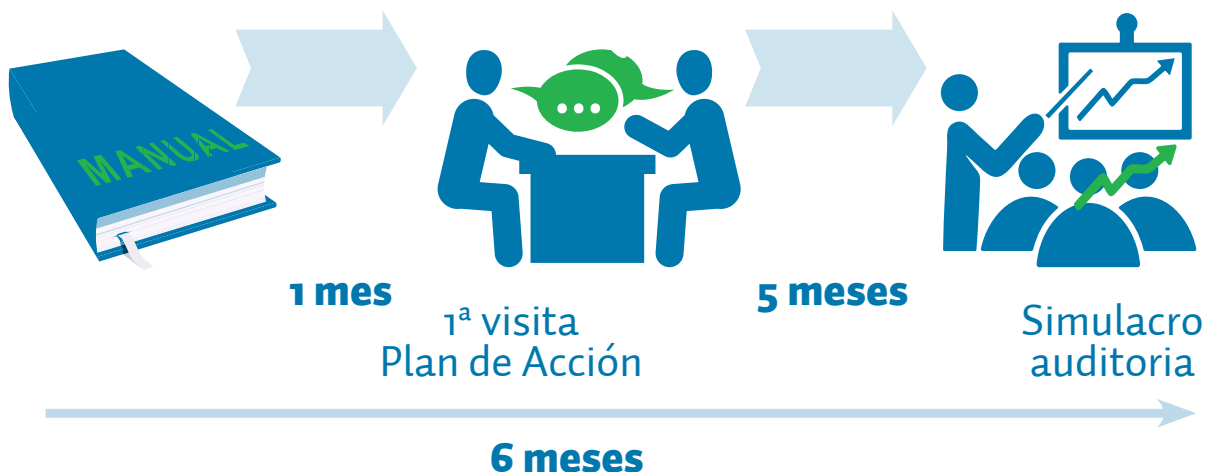
Figura 1: Proceso de consultoría